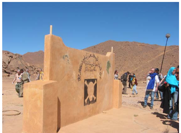
Monuments aux victimes des essais nucléaires français L'un à la limite de la zone contaminée, l'autre à l'intérieur de la zone