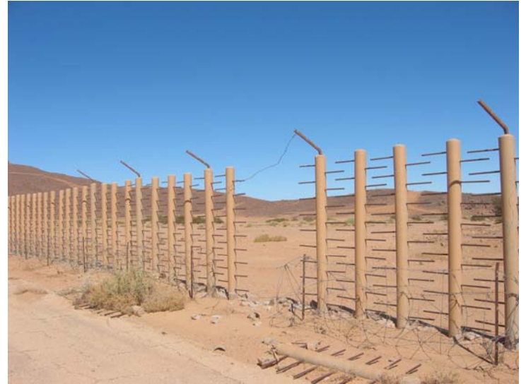
Après le tir Béryl (1 er mai 1962), clôture construite par les Français en 1965 pour délimiter la zone contaminée